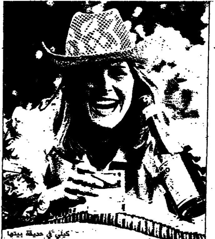
كيلى فى حقيقة بيتها

لا يمكنك ان تضع في اناه الزهور نحلة الى جانب وردة .. كما وان رائحة البصل لا يمكن ان تنسجم مع رائحة القرنفل والياسمين .. تالوردة تجاور الوردة والمطعم ينكس فواحا من مسكبة الياسمين ..